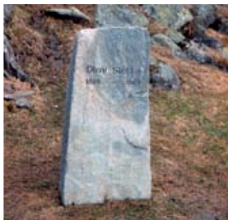
Minnesteinen, reist 1966