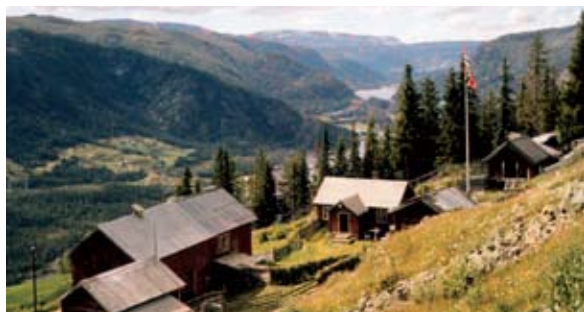
Sletto i 1966