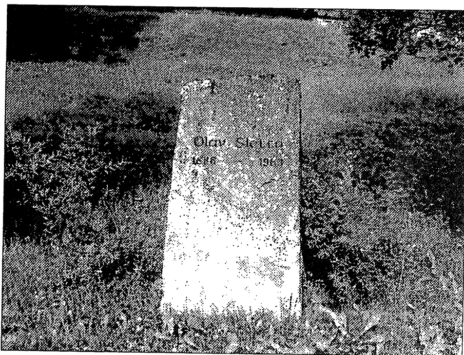
Minnesteinen i Sletto