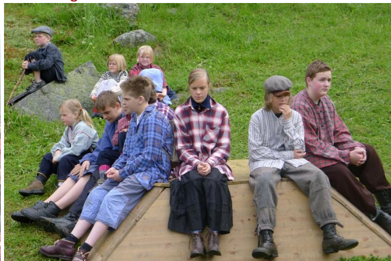
...og tolmodige Skarve- og andre ungar venta på tur.