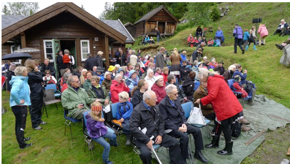
Men regnet skremde ingen. Svallen gjekk medan folket fann plassar...