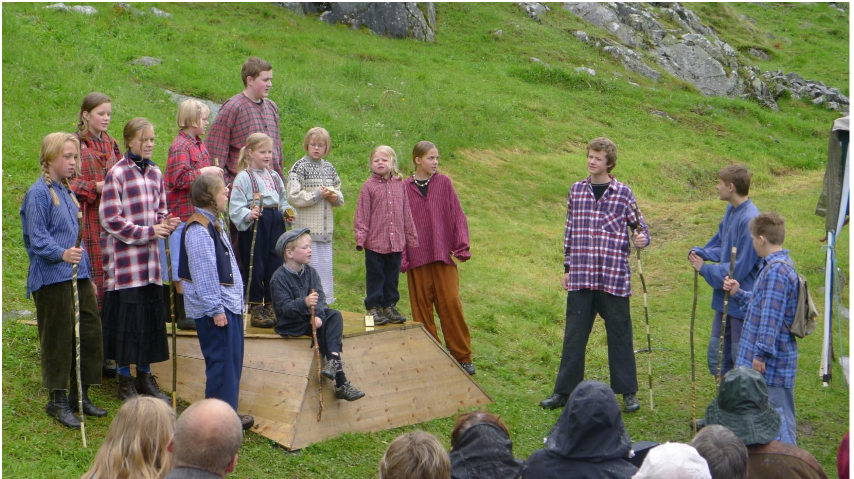
Skarvebarna med flere