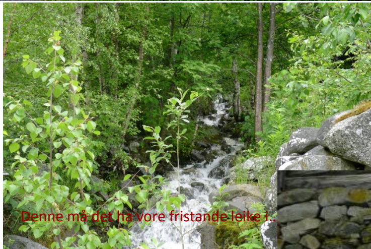
Denne må det ha vore fristande leike j...