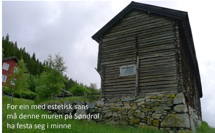
For ein med estetisk sans må denne muren på Søndrol ha festa seg i minne