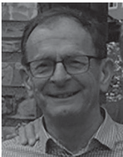
Erling Lae.

Erling Reidar Lae er født i Oslo i 1947, kjent som byrådsleiar i Oslo 2000–2009 og 2. nestleiar i Høyre 2008–2010. I åra 2010–2016 var Erling Lae fylkesmann i f.d. Vestfold fylke. I 2017 vart han slått til riddar av 1. klasse av St. Olavs orden.