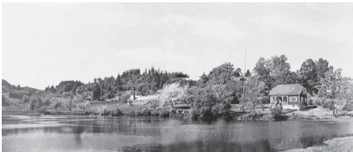
Vesleheimen.